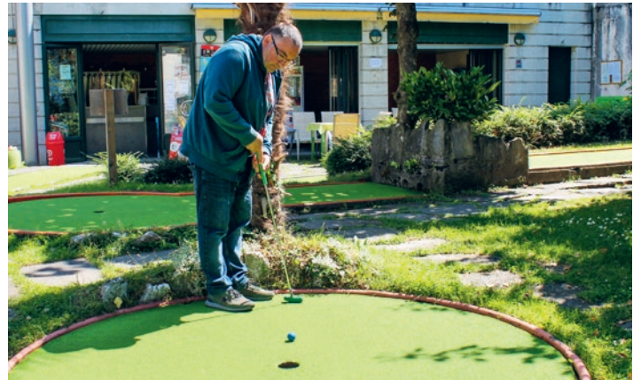
Minigolf in Montreux.

Auch dieses Jahr hatten wir das grosse Glück, keine schwerwiegenden und belastenden Ereignisse oder Zwischenfälle zu haben. Je unspektakulärer ein Jahr bei uns im Wohnbereich vergeht, desto mehr kann Stabilität und Entwicklung bei unseren Bewohnenden ermöglicht werden. Dies erreichten wir auch durch eine tolle Teamkonstanz der Fachpersonen. So war der Fachkräftemangel für uns im letzten Jahr erfreulicherweise keine grosse Herausforderung.