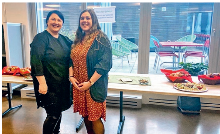
Mit Herz und Leidenschaft: Das neue Leitungsteam im Café Horizonte.

Mit einer menschlichen Portion Unsicherheit, wer da wohl als Nächstes kommen und für unseren Café-Betrieb sorgen mag, aber auch mit grosser Neugier und Freude begrüsst wir im Herbst unsere beiden neuen Fachpersonen.